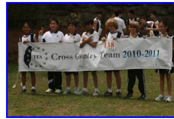
die TES – Year 7s