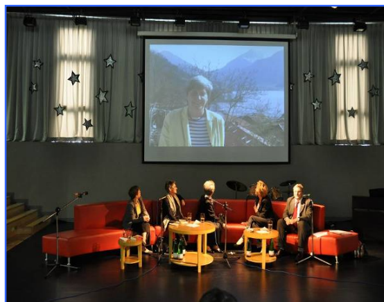
Die Autorin Frau Hornfeck per Video-Botschaft