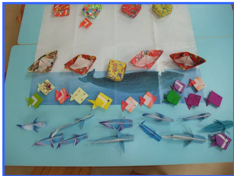
Die Origami-Arbeiten sind super gelungen und haben viel Spaß gemacht!

Die Kinder im Kindergarten freuen sich jetzt schon auf die nächste Station der Weltreise!