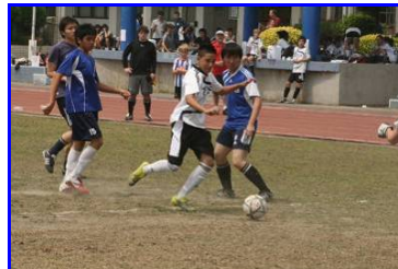
Snuk dribbelstark gegen I-Shou