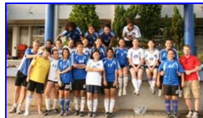
So sehen Sieger aus: TES