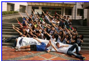
TES Running Team 2011