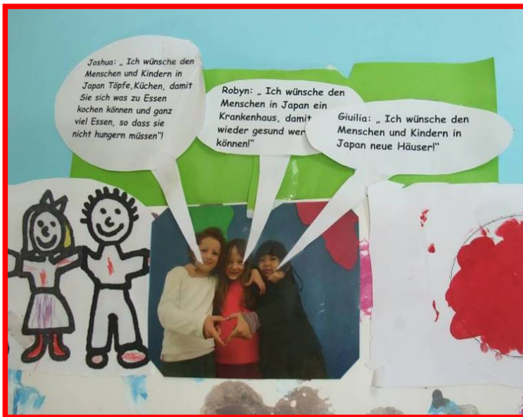
Das wünschen unsere Kinder den Menschen in Japan.