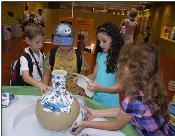
O je! Ming-Vasen in Scherben ...