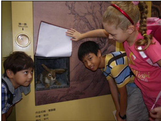
Chinesische Kalligraphie mit Überraschung