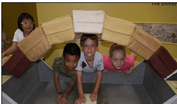
Sie hält! Stolze Bogen-Brücken-Bauer.