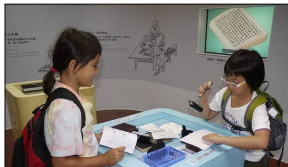
Drucken? Aha - so geht es!