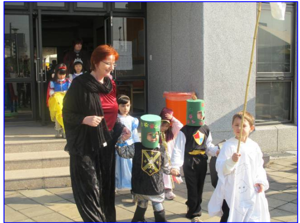
Die Ritter und Burgfräulein aus dem Kindergarten