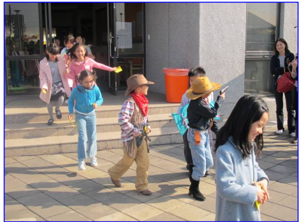
Bücherhelden aus der Märchenwelt der Grundschule