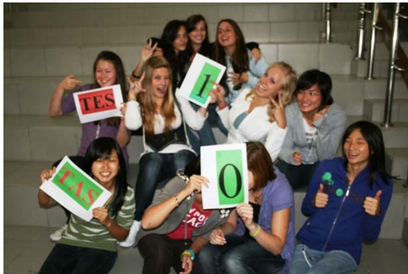
Varsity GIRLS beat TAS 1-0