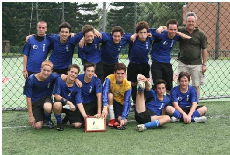
TES Varsity boys with the Trophy