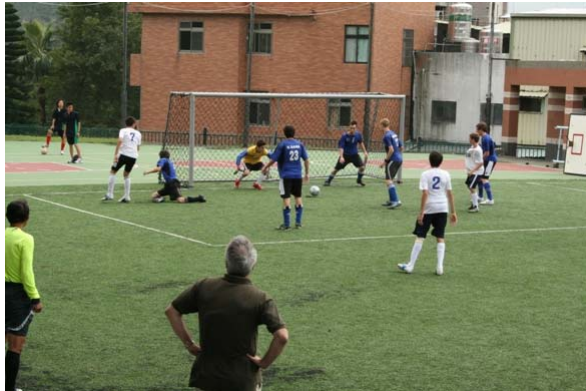
Close to scoring: semi final between the 2 TES Teams