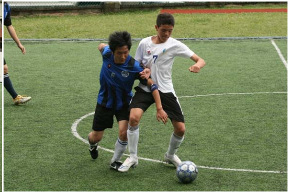
Fobissea Team vs D I S