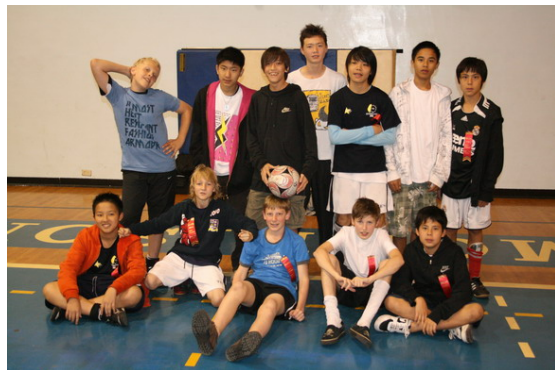
A – Boys Team