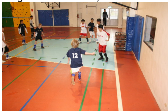
Torchance für die A-Boys: TES schlägt GCA deutlich. Als Tor dient ein Ballwagen, der von allen Seiten (!) getroffen werden kann.