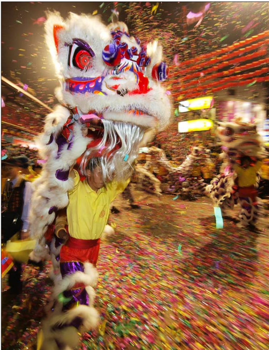
Taiwan by Dirk Diestel

Unglaublicher Lärm der Knallkörper, der Rauch und Mengen von Staub waren weniger schön. Aber eine phantastische „Show“ war der Lohn für die Mühe, am vergangenen Samstagabend nach Dajia bei Taichung zu fahren. Der Geburtstag von Matzu, der Schutzgöttin der Seefahrer und Fischer, wird traditionell im dortigen Matzu-Tempel gefeiert, bevor Punkt Mitternacht eine achttägige Wallfahrt durch viele Städte Taiwans beginnt.