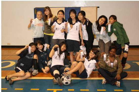
A – Girls Team

C-Division, Mädchen, 5. Platz C-Division, Jungen, 2. Platz B-Division, Mädchen, 2. Platz B-Division, Jungen, kein Team gemeldet A-Division, Mädchen, 3. Platz A-Division, Jungen, 2. Platz