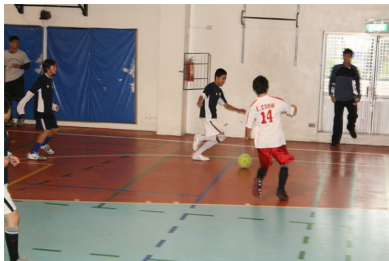
Snuk am Ball ...