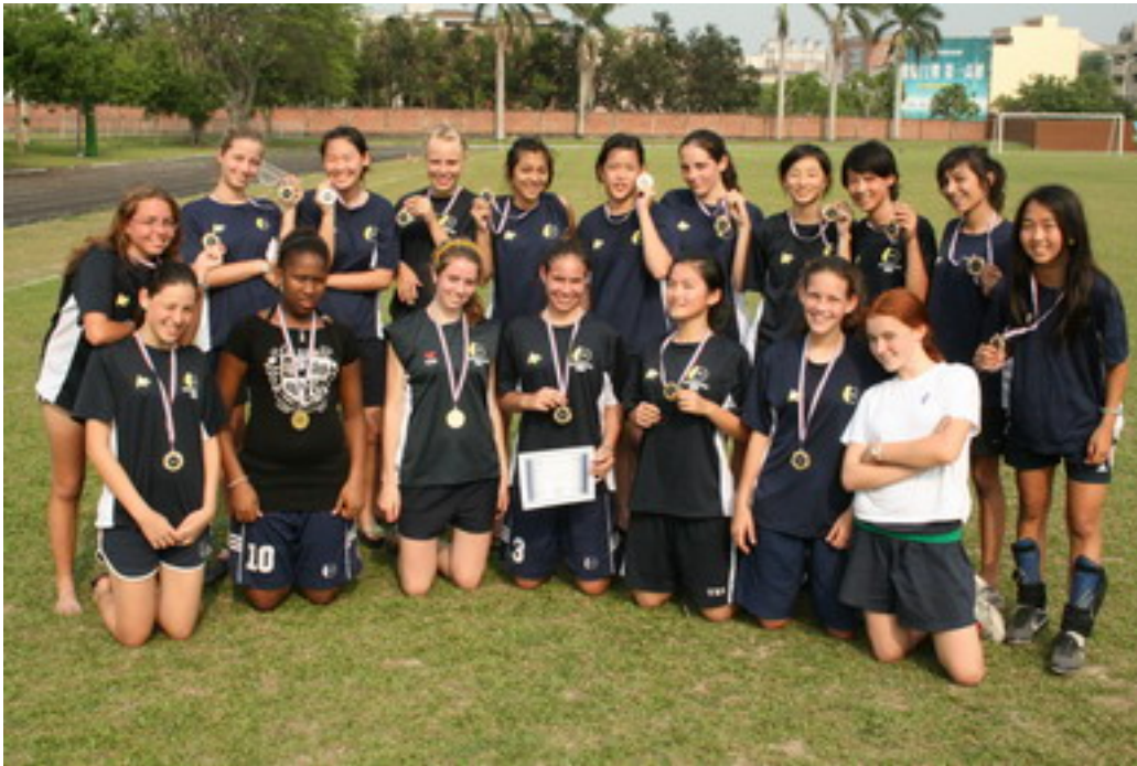
Die Champions: TES Junior Varsity Girls Football Team