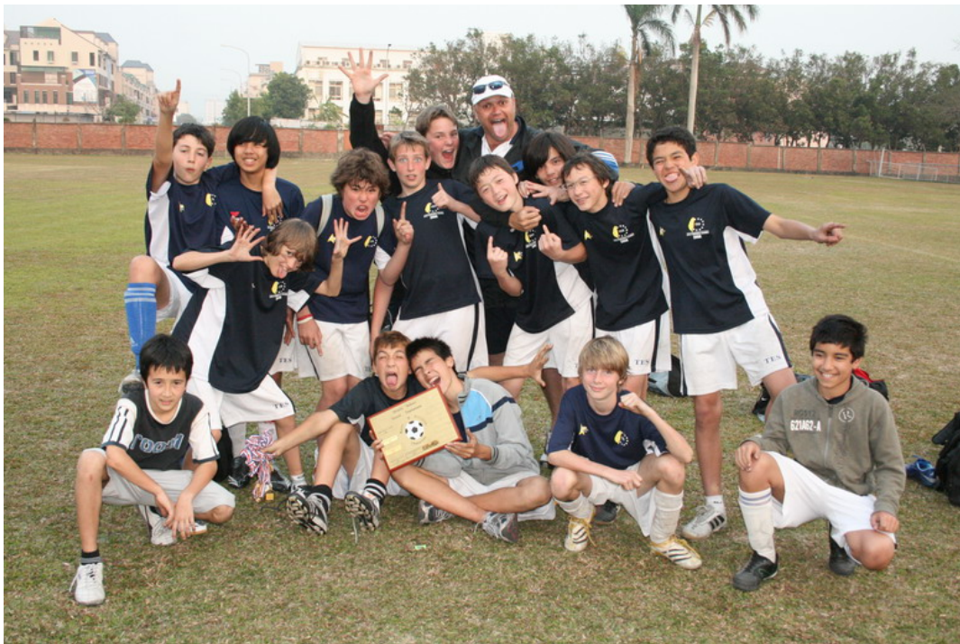
Die Champions: Year 8 Boys