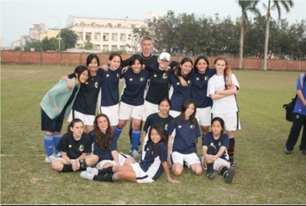
Eigentlich die Besten und doch nur Zweiter: Year 9 Girls