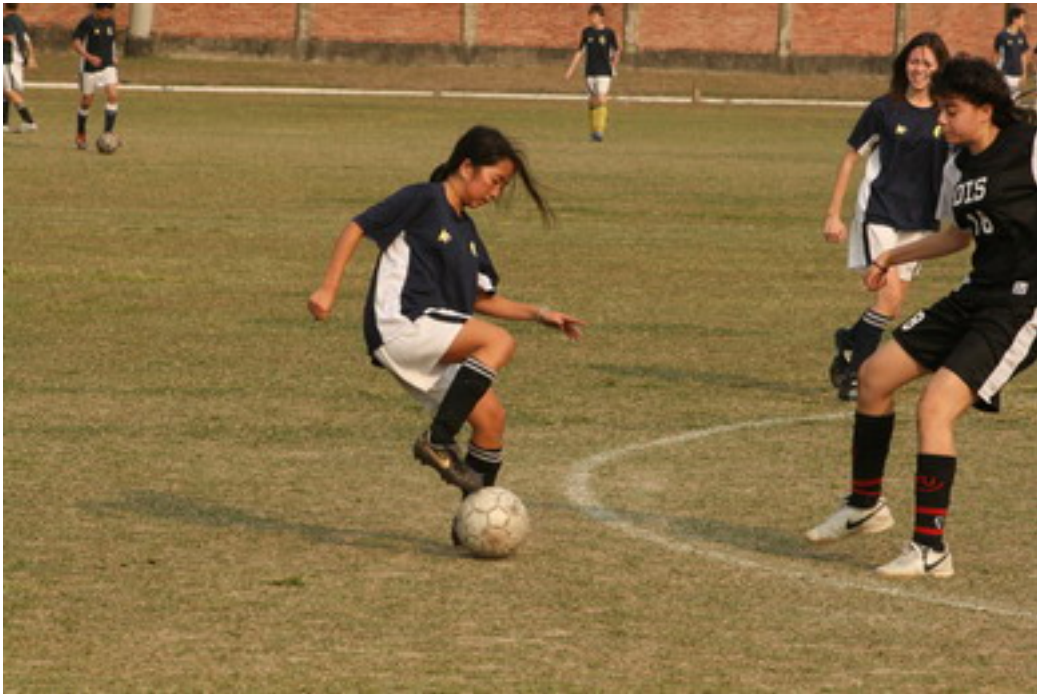
Asaki war die Kleinste auf dem Platz und doch die Spielstärkste