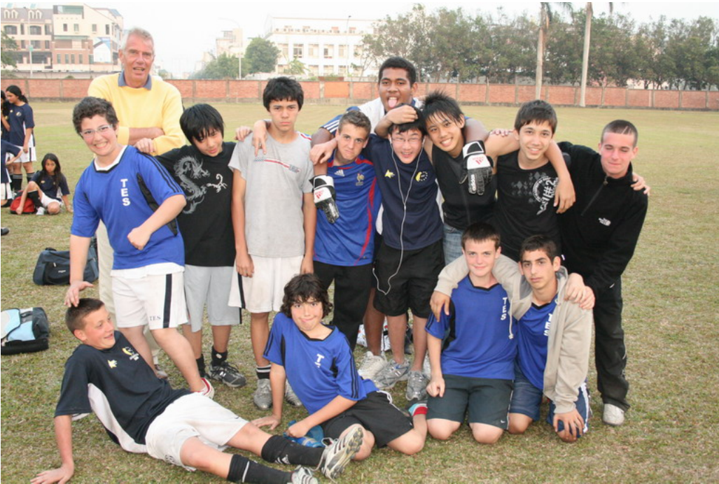
Hervorragend gespielt und doch ausgeschieden: Year 9 Boys