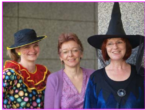
Zu erkennen? Das Grundschul- und das Kindergartenteam.