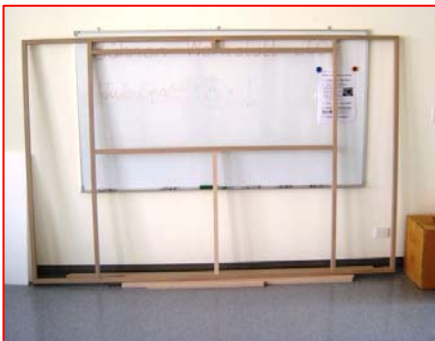
Bühne nach 4 Stunden...