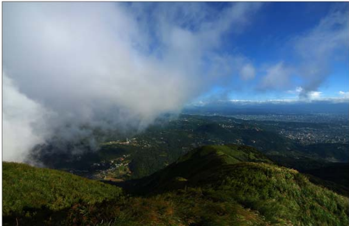
Taipei by Dirk Diestel

Auch für Nichtwanderer ist es relativ einfach, den Gipfel des Mt. Datun im YangMingShan Nationalpark zu erreichen, führt doch eine zwar kurvenreiche, aber gut ausgebaute Straße hinauf. Der 360 Grad Blick von oben ist phantastisch, wenn nicht gerade Wolken und Dunst die Fernsicht einschränken.