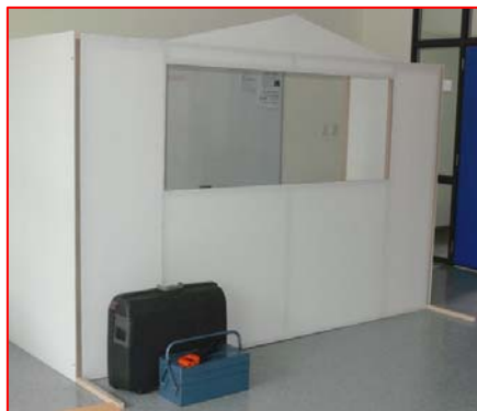
und nach 8 Stunden. Fast fertig!