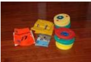
Children's swimming aids