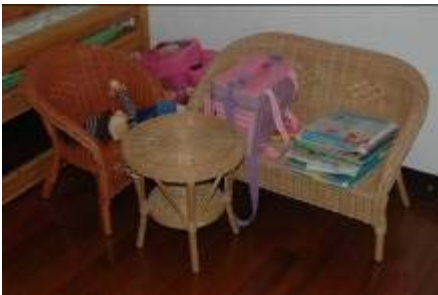
Kids rattan sofa, chair, table