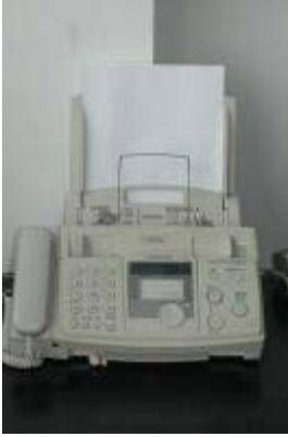
1 Panasonic fax machine