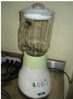
Sampo Mixer NT$ 500