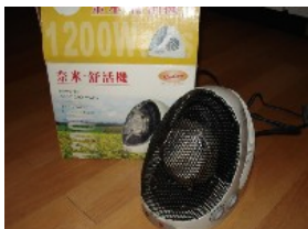
Nano Heizlüfter 600/1200 Watt, Fan-Forced Ceramic Heat, Thermostat Temperature Control, Safety Thermal Cut-Off NT$ 2.000