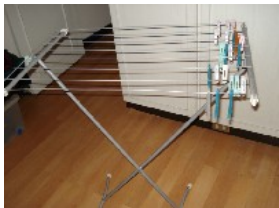
Klappbarer Wäscheständer NT$ 300