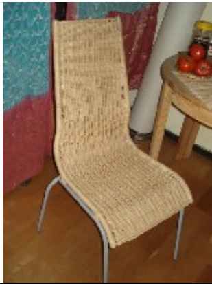
2 x Korbstühle NT$ 800