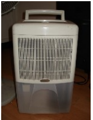
Luftentfeuchter klein (ca. 5 Liter) NT$ 1.000