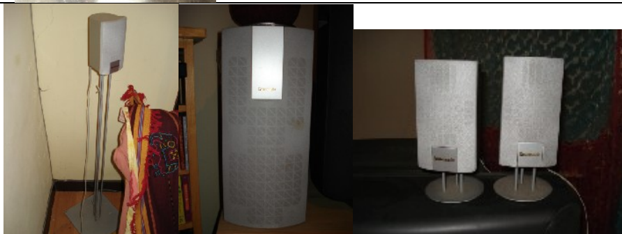
Panasonic All-round sound boxen (1 x groß, 5 x klein, 2 x lange Ständer, 3 x kurze Ständer) NT$ 3.000