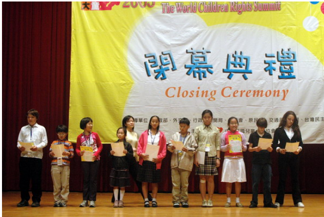
Foto der Abschlussveranstaltung des Kindergipfels 2005

Ende Oktober wird der 6. International Gipfel in Taiwan zu Kinderechten stattfinden. Ausgerichtet wird dieser von einer regierungsunabhängigen Organisation, deren Ziel die Wahrung von Rechten der Kinder durch eine jugendliche Diskussionsgruppe ist. Taiwanweit fanden schwierige