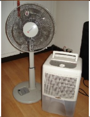
Stehfan NT$ 400