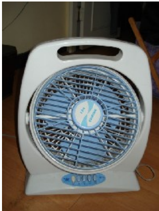
kleiner Fan NT$ 300