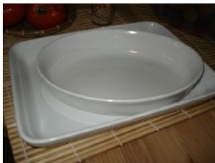
2 x Auflaufformen NT$ 300