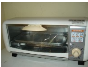
Tatung Kleingrill NT$ 400