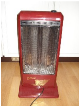
Heizstrahler NT$ 500