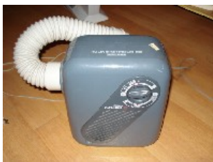
Japanischer Bettwärmer (sehr hilfreich bei klammen Betten im Winter) NT$ 500