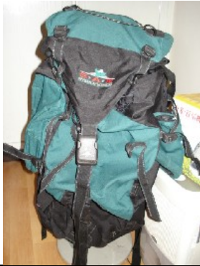
Sam Trekkingrucksack (für Leute ab 175 cm) NT$ 2.000