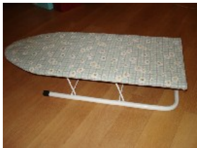
Klappbares Bügelbrett NT$ 300