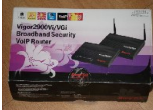
Draytek Broadband Security VoIP Router NT$ 3.000