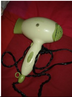
Fön NT$ 200