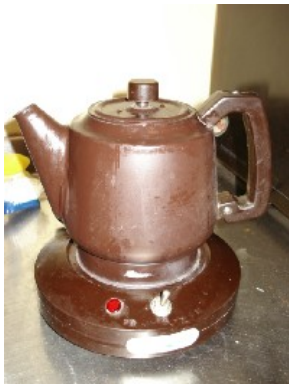
Wasserkocher NT$ 500